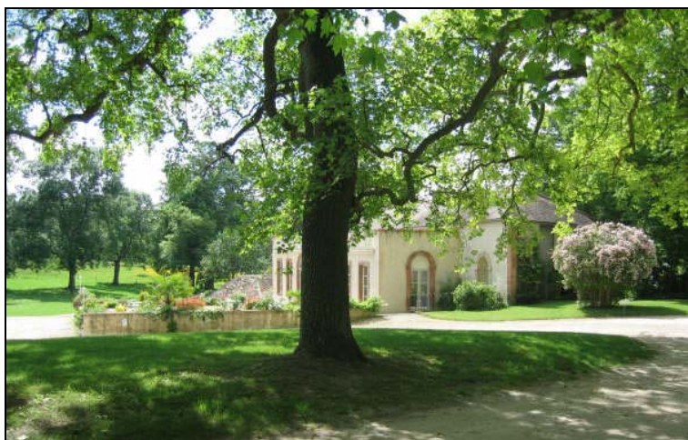
tulipier de Virginie bicentenaire face à l'Orangerie la grotte et la cascade de la comtesse de Blot

Visites guidées en petits groupes : réservation obligatoire minimum 36 heures à l'avance. Circuit de 1h30 pour la première partie de l'arboretum (espace facilement accessible) Ou circuit de 2h aux environs du château et la grotte du XVIII° (inscrits à l'inventaire)