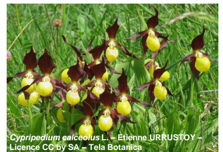
Cypripedium calceolus L.

La mission flore « Sabot de Vénus » ( Cypripedium calceolus ) a permis l'observation de cette orchidée rare autour de Grenoble