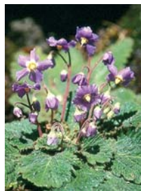
Ramonde des Pyrénées