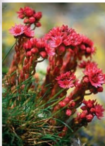
Joubarbe à toiles d'araignées