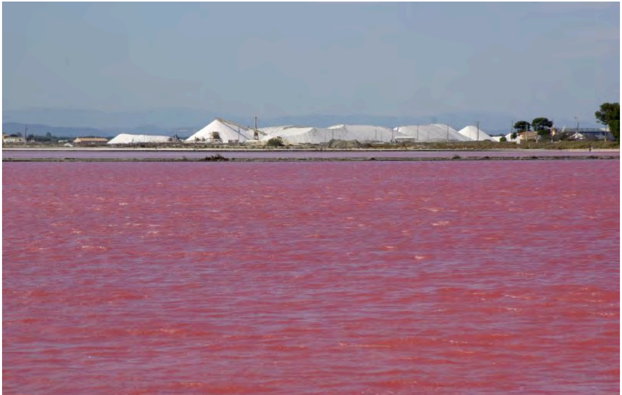
Salines d'Aigues-Mortes colorées par la microalgue Dunaliella salina