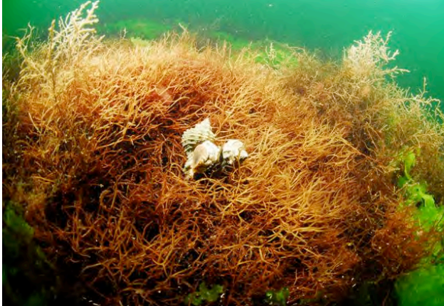
Macroalgues marines