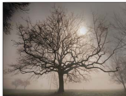
Chêne à Valojoux

Le regard d'un photographe est celui qui permet de voir le beau, de retranscrire la vie sous toutes ses formes. C'est donner du rêve et de l'évasion. C'est figer le temps, l'émotion. C'est écrire avec la lumière.