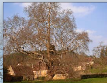
Platane proche de Bergerac

« En m'approchant de la colline où il se tient en vigile de silence, Il grandit à mes yeux. Il s'anime à mes oreilles et la main qui en caresse le tronc me dit sa puissance. Des battements sourds se font entendre. Je ne sais d'abord leur provenance, ils sont de mon propre cœur... »