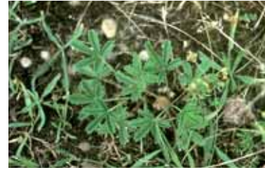
Abb. 2: Grundblattrosette von Potentilla alsatica . Neuf-Brisach, 27. 7. 2001.

Caudex multiceps , tempore florendi surculis brevibus sterilibus. Folia radicalia et caulina inferna mediaque 5(–7)-nata, concava, apice rubro, margo in plantas vivas incrassatus in plantas exsiccatas revolutus, supra modice pilis rectis 0,4–0,8 mm longis, subtus ± virescentes ad nervos pilis rectis usque 1,3 mm longis inter nervos modice pilis crispis; petioli plerumque 3–5 cm longi, modice pilis curtis flexuosis et usque 1,8 mm longis rectis; folioli terminales concavi, anguste obovati, plerumque 2–2,5(–3) cm longi, a medio incisii-serrati dentibus utrinque (3–)4–5, dente terminali vulgo non exserto. Stipulae infimae auriculis linearibus et profunde pilis longis rectis, stipulae caulinae auriculis obliquis ovatis acutis. Folia caulina supera 3-nata foliolo terminali antice manifeste lato dentibus plerumque 3. Caules ascendentes multiflori (saepe > 50) plerumque a inferno parte ramosi pilis curtis flexuosis et longis ± rectis. Flores circa 10 mm diametro, pedunculis 10–15 mm longis saepe curvatis pilis flexuosis et percurtis