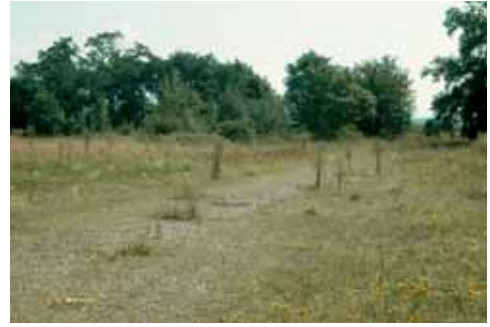
Abb. 5: Ehemaliges Militärgelände nördlich von Neuf-Brisach mit Schotterpisten, 27. 7. 2001. Potentilla alsatica wächst auf ehemaligen Fahrwegen.