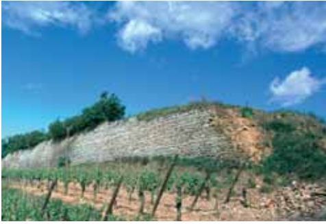
Abb. 4: Fundort von Potentilla alsatica auf dem Letzenberg, 14. 5. 2002. Der kleine Bestand befindet sich auf dem rechten Randbereich der Mauer.