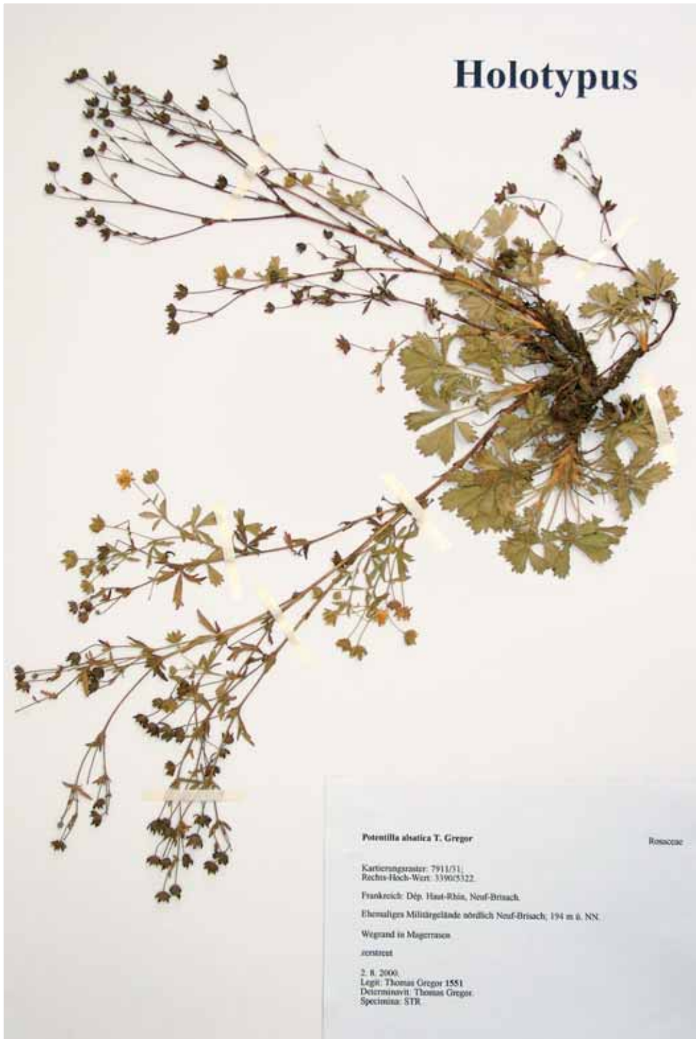
Abb. 1: Holotypus von Potentilla alsatica T. Gregor