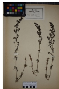
à inconnu observée le 1 janvier 1855 par Herbier Pontarlier-marichal

Réseau Tela botanica, Programme Flora Data, version dynamique.