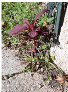
à inconnu observée le 11 novembre 2018 par Vanessa Boudet

Réseau Tela botanica, Programme Flora Data, version dynamique.