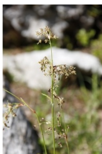
à inconnu observée le 7 juin 2015 par Fabienne Paire

Réseau Tela botanica, Programme Flora Data, version dynamique.