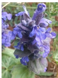
à inconnu observée le 1 mai 2014 par Jean-François Molino

Réseau Tela botanica, Programme Flora Data, version dynamique.