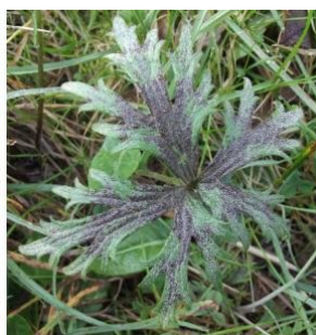
à inconnu observée le 8 mars 2014 par jcech

Réseau Tela botanica, Programme Flora Data, version dynamique.