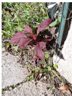
à inconnu observée le 11 novembre 2018 par Vanessa Boudet

Réseau Tela botanica, Programme Flora Data, version dynamique.