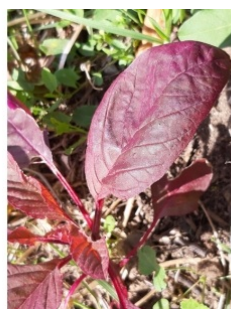
à inconnu observée le 11 novembre 2018 par Vanessa Boudet

Réseau Tela botanica, Programme Flora Data, version dynamique.