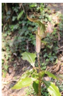
à inconnu observée le 7 avril 2014 par Gilbert Grosdidier

Réseau Tela botanica, Programme Flora Data, version dynamique.