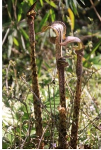
à inconnu observée le 7 avril 2014 par Gilbert Grosdidier

Réseau Tela botanica, Programme Flora Data, version dynamique.