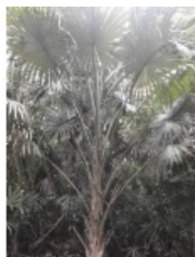
à inconnu observée le 23 janvier 2010 par Genevieve Botti

Réseau Tela botanica, Programme Flora Data, version dynamique.