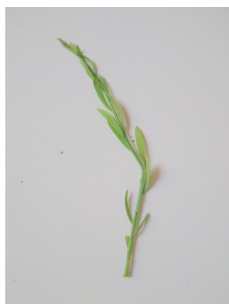
à inconnu observée le 2 mai 2020 par Julie Triché

Réseau Tela botanica, Programme Flora Data, version dynamique.