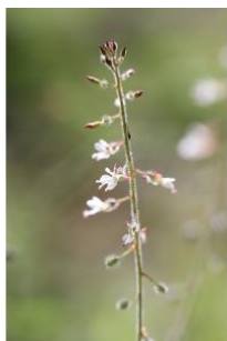
à inconnu observée le 1 août 2014 par Guillaume Blondeau

Réseau Tela botanica, Programme Flora Data, version dynamique.