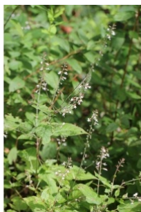
à inconnu observée le 1 août 2014 par Guillaume Blondeau

Réseau Tela botanica, Programme Flora Data, version dynamique.