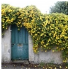
à inconnu observée le 28 mai 2013 par BERNARD Ginesy

Réseau Tela botanica, Programme Flora Data, version dynamique.