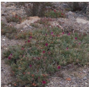
à inconnu observée le 24 octobre 2015 par Liliane Roubaudi

Réseau Tela botanica, Programme Flora Data, version dynamique.