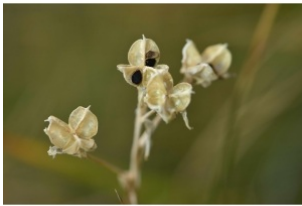
à inconnu observée le 31 août 2016 par Jean Paul Saint Marc

Réseau Tela botanica, Programme Flora Data, version dynamique.