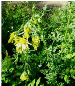
à inconnu observée le 20 mai 2016 par Alain Bigou

Réseau Tela botanica, Programme Flora Data, version dynamique.