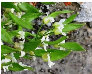
à inconnu observée le 25 juin 2018 par Alain Bigou

Réseau Tela botanica, Programme Flora Data, version dynamique.