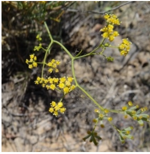
à inconnu observée le 4 septembre 2013 par Alain Bigou

Réseau Tela botanica, Programme Flora Data, version dynamique.