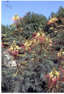
à inconnu observée le 8 juillet 2002 par Liliane Roubaudi

Réseau Tela botanica, Programme Flora Data, version dynamique.