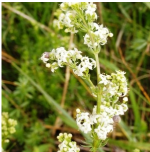
à inconnu observée le 25 mai 2006 par Alain Bigou

Réseau Tela botanica, Programme Flora Data, version dynamique.