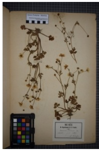
à inconnu observée le 1 juin 1873 par Herbier Pontarlier-marichal

Réseau Tela botanica, Programme Flora Data, version dynamique.