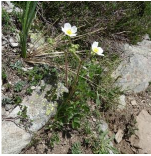
à inconnu observée le 9 juin 2015 par Alain Bigou

Réseau Tela botanica, Programme Flora Data, version dynamique.