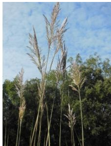
à inconnu observée le 9 septembre 2018 par Quentin Lebastard

Réseau Tela botanica, Programme Flora Data, version dynamique.