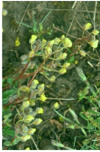
à inconnu observée le 20 mai 2013 par Françoise Carle

Réseau Tela botanica, Programme Flora Data, version dynamique.