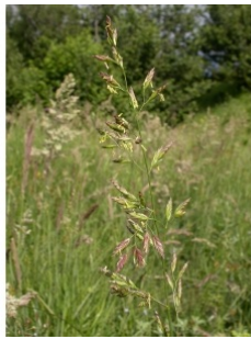
à inconnu observée le 3 juillet 2007 par Julien Barataud

Réseau Tela botanica, Programme Flora Data, version dynamique.