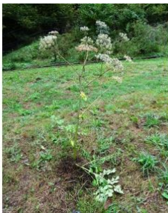
à inconnu observée le 7 octobre 2015 par Alain Bigou

Réseau Tela botanica, Programme Flora Data, version dynamique.