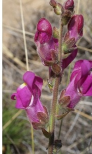
à inconnu observée le 28 avril 2016 par Liliane Roubaudi

Réseau Tela botanica, Programme Flora Data, version dynamique.