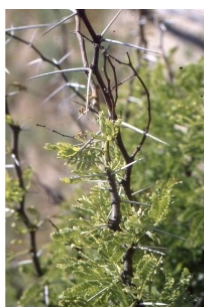
à inconnu observée le 16 avril 2000 par Liliane Roubaudi

Réseau Ela botanica , Programme Flora Data, version dynamique.