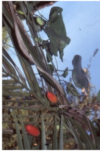
à inconnu observée le 21 janvier 2006 par Liliane Roubaudi

Réseau Tela botanica, Programme Flora Data, version dynamique.