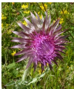
à inconnu observée le 20 mai 2012 par Ans Gorter

Réseau Tela botanica, Programme Flora Data, version dynamique.