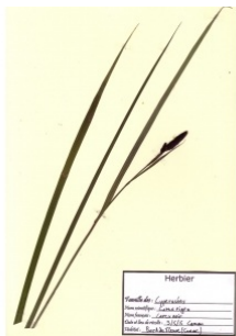
à inconnu observée le 15 mai 2005 par Laurent Petit

Réseau Tela botanica, Programme Flora Data, version dynamique.