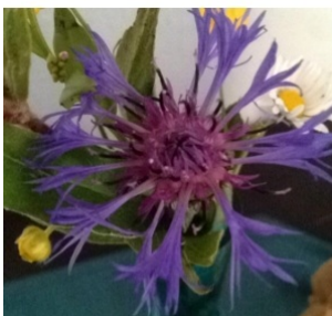
à inconnu observée le 31 mai 2014 par djimbati@...

Réseau Tela botanica, Programme Flora Data, version dynamique.