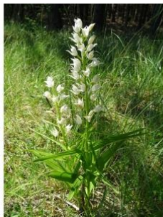
à inconnu observée le 18 juin 2019 par Jean-Claude Calais

Réseau Tela botanica, Programme Flora Data, version dynamique.