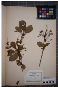
à inconnu observée le 1 mai 1853 par Herbier Pontarlier-marichal

Réseau Tela botanica, Programme Flora Data, version dynamique.