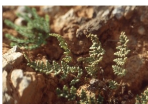
à inconnu observée le 10 avril 1993 par Liliane Roubaudi

Réseau Tela botanica, Programme Flora Data, version dynamique.