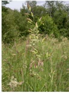
à inconnu observée le 3 juillet 2007 par Julien Barataud

Réseau Tela botanica, Programme Flora Data, version dynamique.