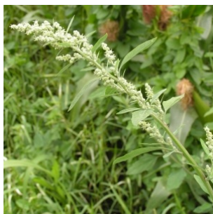
à inconnu observée le 2 septembre 2004 par Alain Bigou

Réseau Tela botanica, Programme Flora Data, version dynamique.