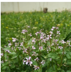
à inconnu observée le 25 mars 2020 par poursafavi@...

Réseau Tela botanica, Programme Flora Data, version dynamique.