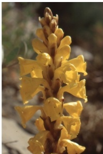
à inconnu observée le 22 avril 1992 par Liliane Roubaudi

Réseau Tela botanica, Programme Flora Data, version dynamique.