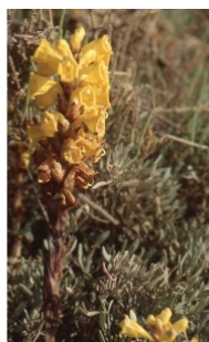
à inconnu observée le 22 avril 1992 par Liliane Roubaudi

Réseau Tela botanica, Programme Flora Data, version dynamique.