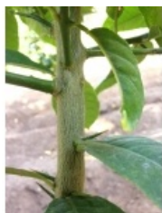
à inconnu observée le 26 septembre 2013 par Hervé Goëau

Réseau Tela botanica, Programme Flora Data, version dynamique.