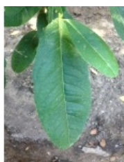
à inconnu observée le 26 septembre 2013 par Hervé Goëau

Réseau Tela botanica, Programme Flora Data, version dynamique.