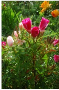
à inconnu observée le 2 août 2012 par Patrick Bouvier

Réseau Tela botanica, Programme Flora Data, version dynamique.