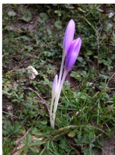
à inconnu observée le 1 octobre 2004 par ann2005

Réseau Tela botanica, Programme Flora Data, version dynamique.