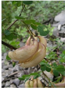
à inconnu observée le 27 juin 2010 par Sylvain Piry

Réseau Tela botanica, Programme Flora Data, version dynamique.