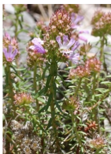
à inconnu observée le 19 mai 2014 par Marie Portas

Réseau Tela botanica, Programme Flora Data, version dynamique.