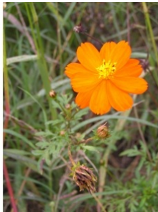
à inconnu observée le 27 septembre 2005 par Alain Bigou

Réseau Tela botanica, Programme Flora Data, version dynamique.