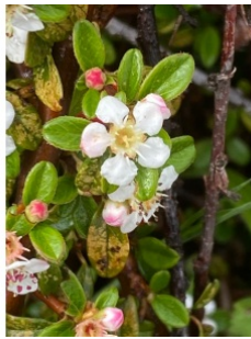
à inconnu observée le 27 avril 2020 par François Fares Mansour

Réseau Tela botanica, Programme Flora Data, version dynamique.